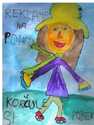
Natália Ďurková, III.