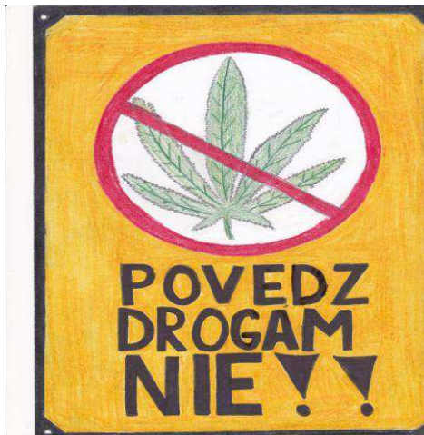
Reklama na pohodu – I. stupeň